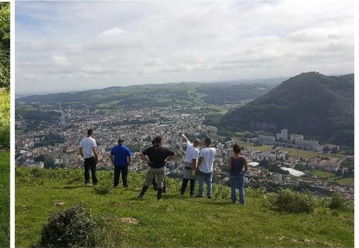
Photos prises lors du chantier « 1 er pas vers l'emploi, balisage des sentiers de l'agglomération TLP »