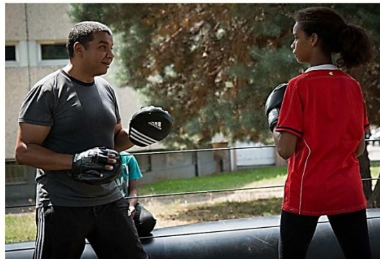
Atelier boxe sur le quartier Solazur

Cette initiative a été organisée avec l'appui de la ville de Tarbes et du Département, et avec un soutien du Fonds de Participation des Habitants.