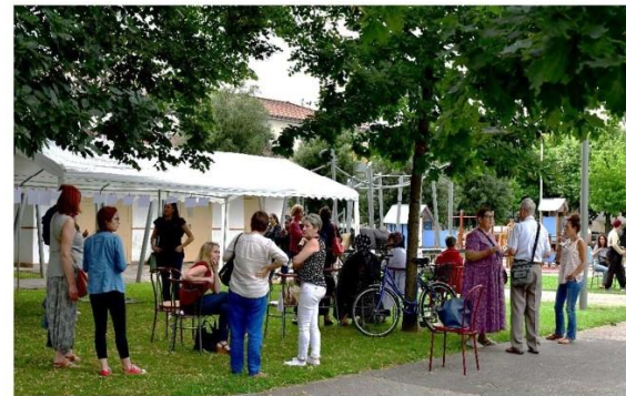
Soirée du 22 juin organisée par le conseil citoyen de Laubadère